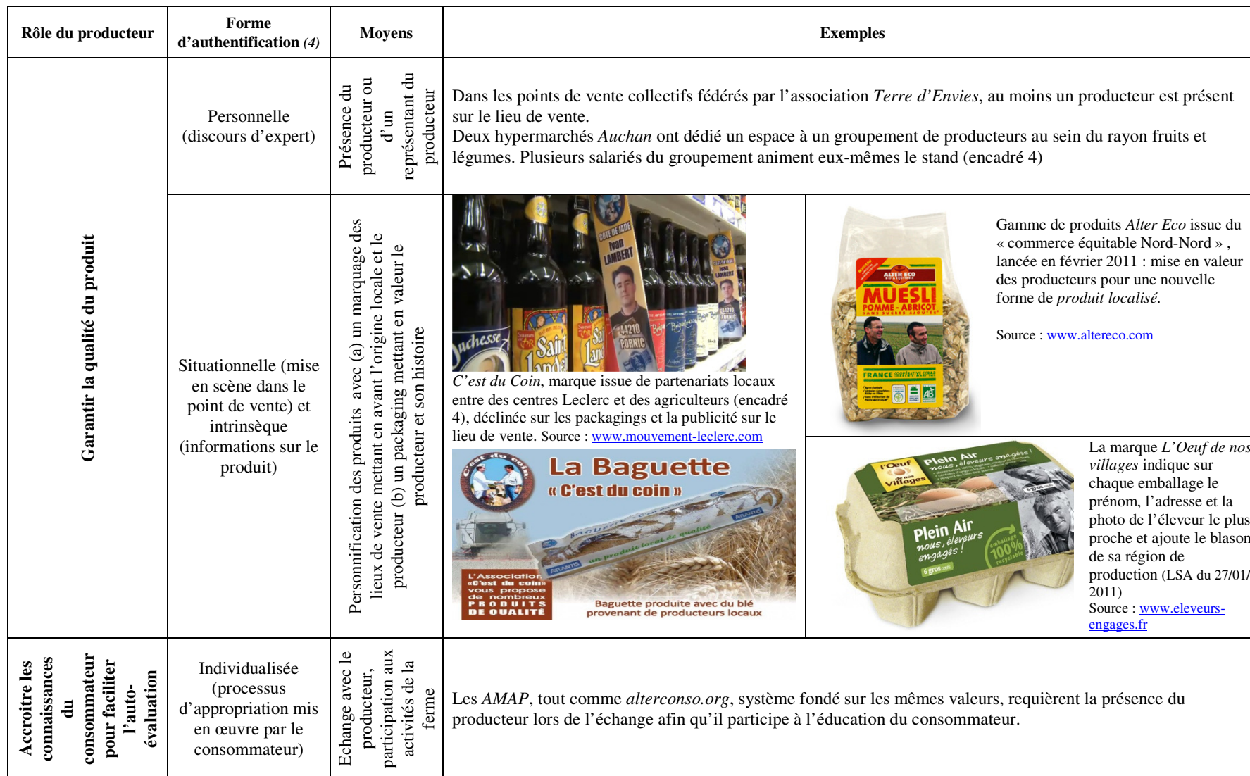
Tableau 1 : Le rôle du producteur dans l'authentification de la qualité des produits locaux